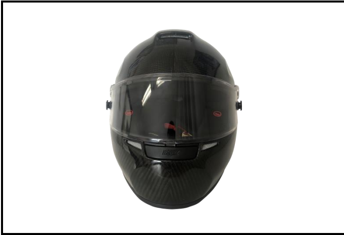
D1) Vue de face / Front view