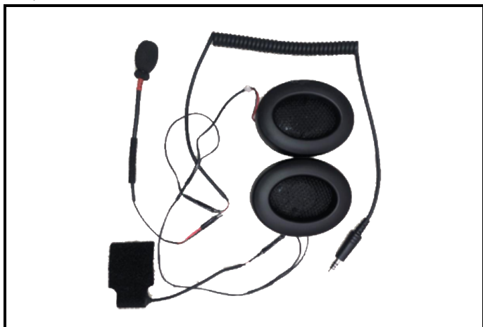
E1) COMMUNICATION SYSTEM