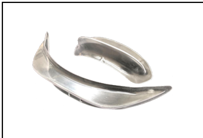
E2) FRONT SPOILER