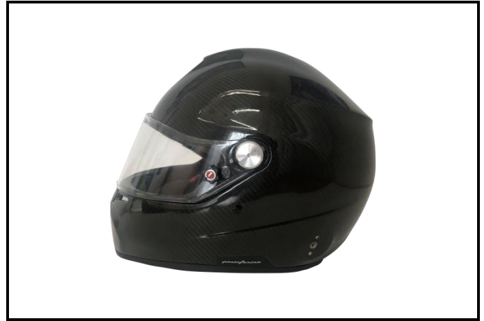
D2) Vue du Côté Droite / Right Side view