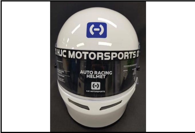
D1) Vue de face / Front view