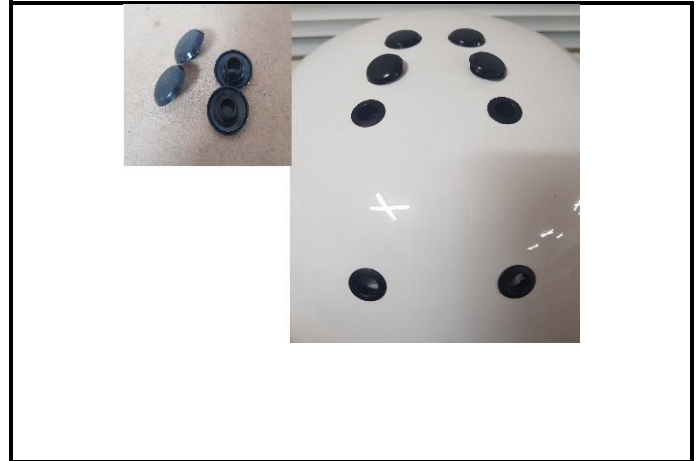
E4) VENT PLUGS