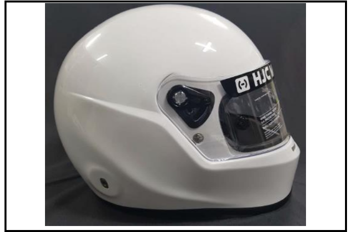
D2) Vue du Côté Droite / Right Side view