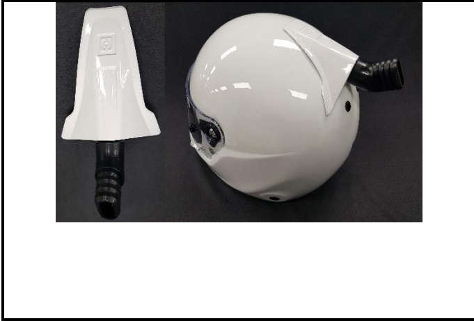
E1) FORCED AIR