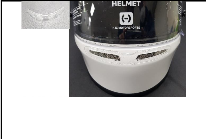
E3) LOWER VENT COVER