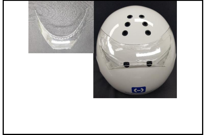
E2) REAR SPOILER