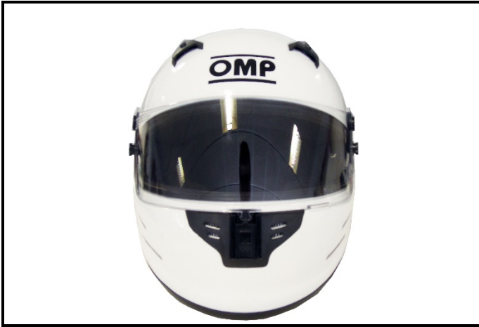
D1) Vue de face / Front view