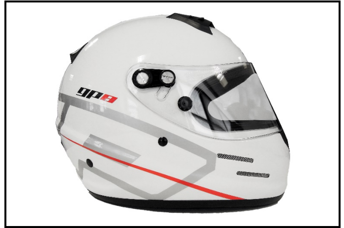
D2) Vue du Côté Droite / Right Side view