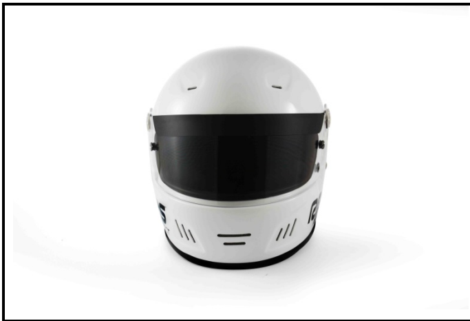
D1) Vue de face / Front view