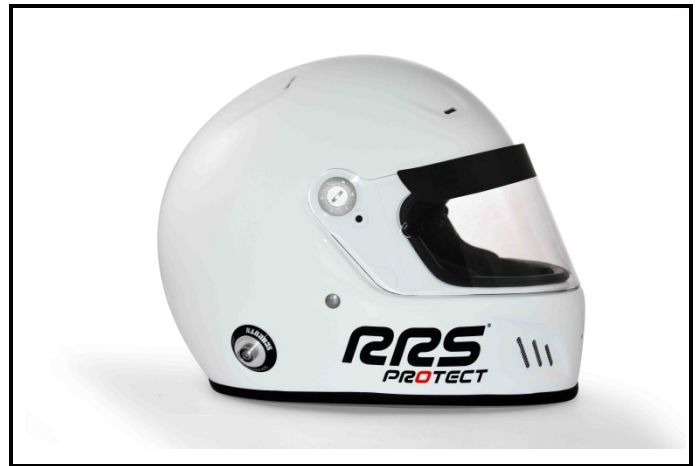
D2) Vue du Côté Droite / Right Side view