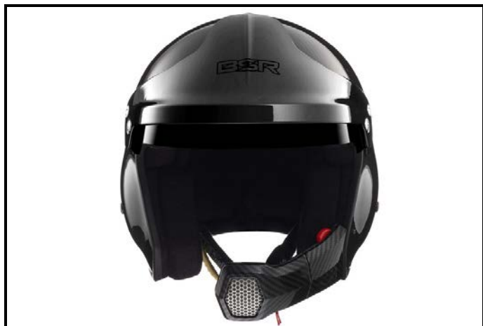
D1) Vue de face / Front view