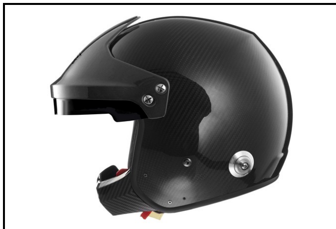
D2) Vue du Côté Droite / Right Side view