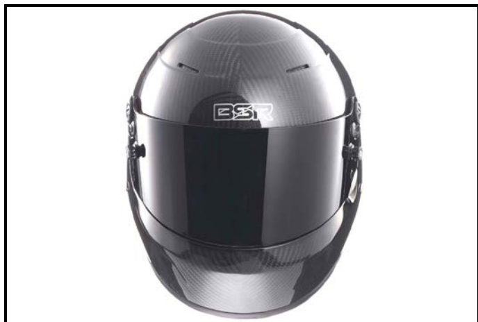
D1) Vue de face / Front view