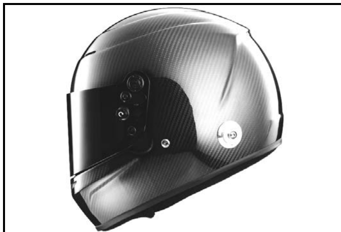
D2) Vue du Côté Droite / Right Side view