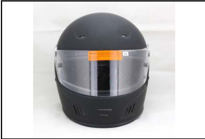
D1) Vue de face / Front view