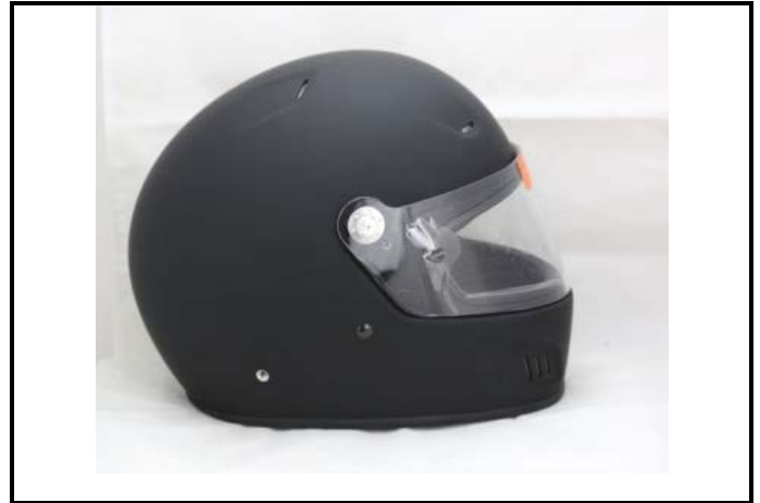
D2) Vue du Côté Droite / Right Side view