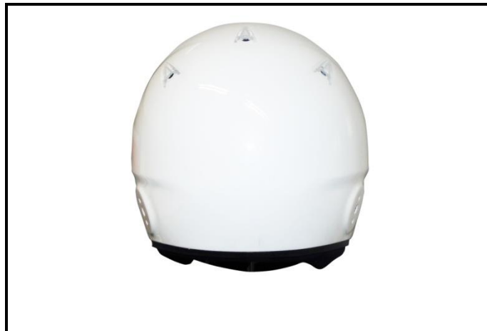
D2) Vue du Côté Droite / Right Side view