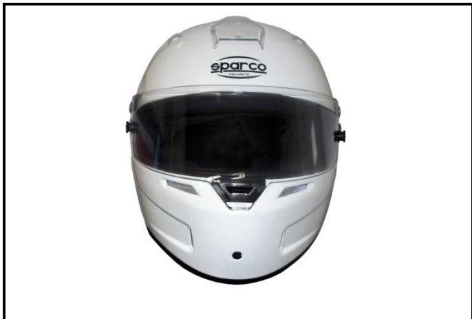
D1) Vue de face / Front view