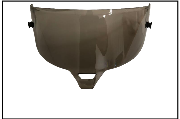
E2) VISOR IRIDIUM GREY