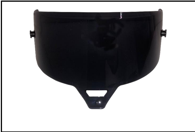
E1) VISOR DARK