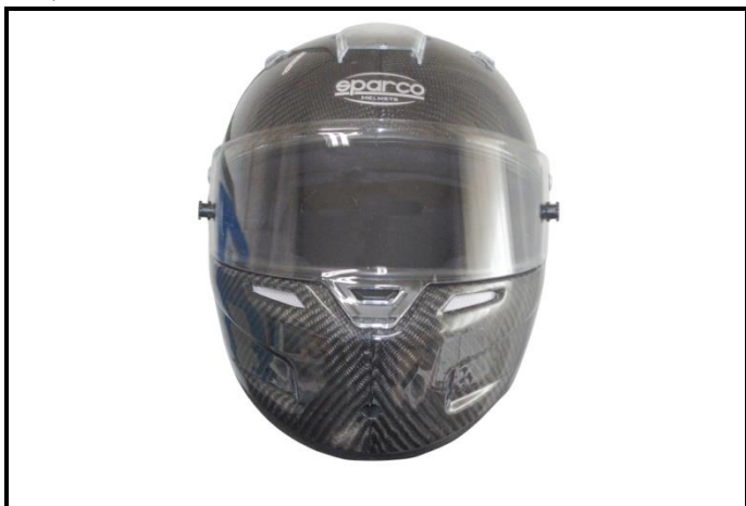
D1) Vue de face / Front view