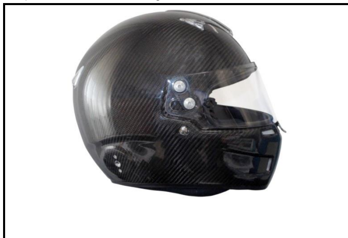
D2) Vue du Côté Droite / Right Side view