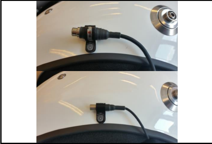
E1) Clip connector for ear-plug lemo, RCA and jack 3.5mm