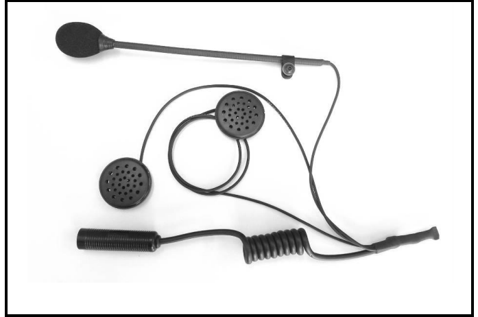
E2) Radio Connection (microphone with boom)