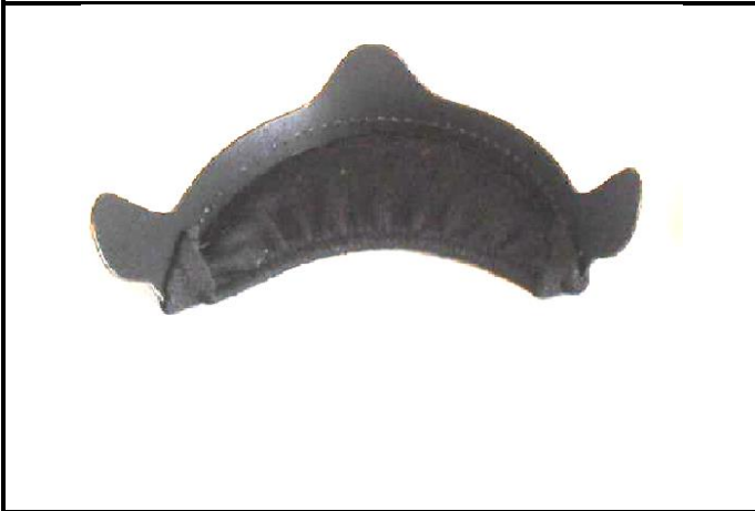
E3) Chin flap