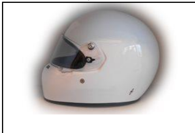
D2) Vue du Côté Droite / Right Side view