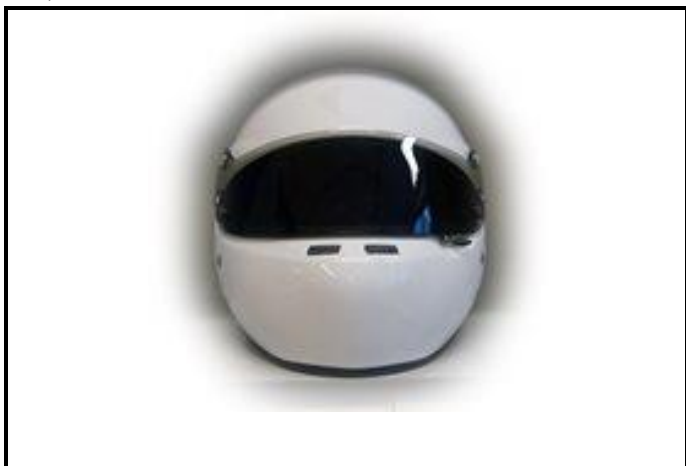
D1) Vue de face / Front view