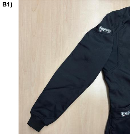
Photo de la Manche flottante (arrière) Photo of the Floating Sleeve (back)

Photo de la Manche flottante (avant) Photo of the Floating Sleeve (front)