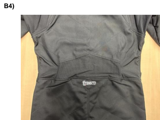
Photo du Bas du dos Photo of the Lower Back