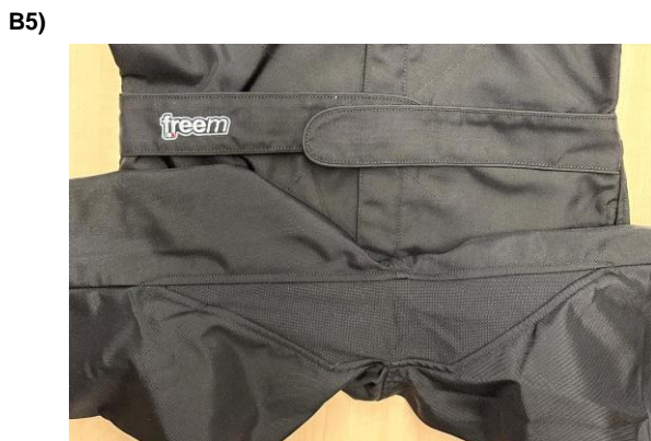
Photo de la zone de l'Entrejambe Photo of the Crotch area