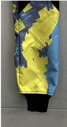
Photo de l'option boot cut Photo of boot cut option