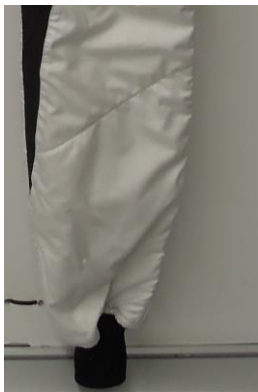
Photo de l'option boot cut Photo of boot cut option