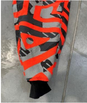
Photo de l'option boot cut Photo of boot cut option