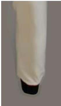
Photo de l'option boot cut Photo of boot cut option