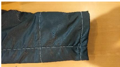
Photo de l'option boot cut Photo of boot cut option