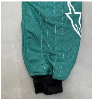
Photo de l'option boot cut Photo of boot cut option