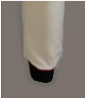
Photo de l'option boot cut Photo of boot cut option