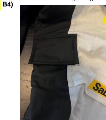
Photo de l'ouverture supplémentaire avec son rabat Photo of the additional opening with flap

Nombre d'ouvertures supplémentaires 1 Number of additional openings