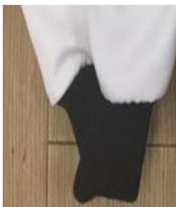
Photo de l'option boot cut Photo of boot cut option