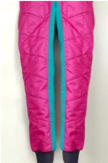
Photo de l'option boot cut Photo of boot cut option