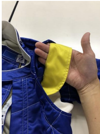
Les couleurs peuvent être modifiées. Colours may be changed.

B1) vue de ¾ avec position de la main pour saisir la poignée ¾ view with position of the hand for grabbing the handle