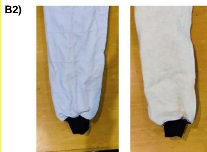
Photo de l'option boot cut Photo of boot cut option

Photo de la terminaison normale Photo of standard termination