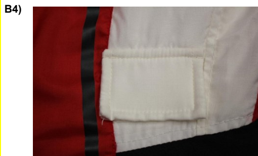
Photo de l'ouverture supplémentaire avec son rabat Photo of the additional opening with flap

Nombre d'ouvertures supplémentaires Number of additional openings 1