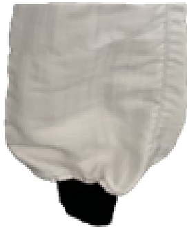
Photo de l'option boot cut Photo of boot cut option