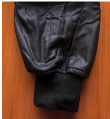
Photo de l'option boot cut Photo of boot cut option