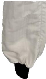
Photo de l'option boot cut Photo of boot cut option