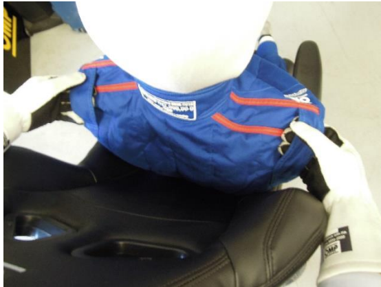
Les couleurs peuvent être modifiées. Colours may be changed.