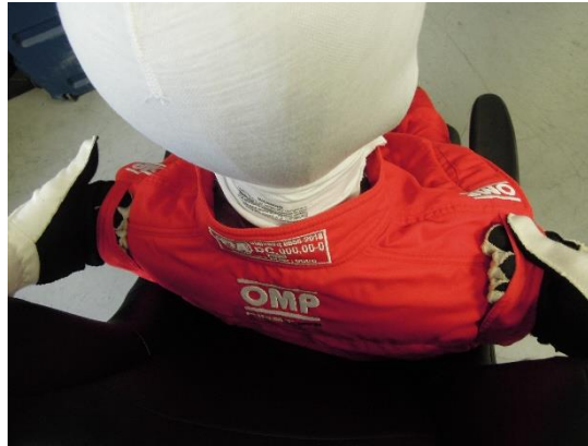
Les couleurs peuvent être modifiées. Colours may be changed.