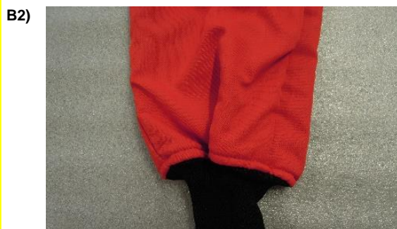
Photo de l'option boot cut Photo of boot cut option

Photo de la terminaison normale Photo of standard termination