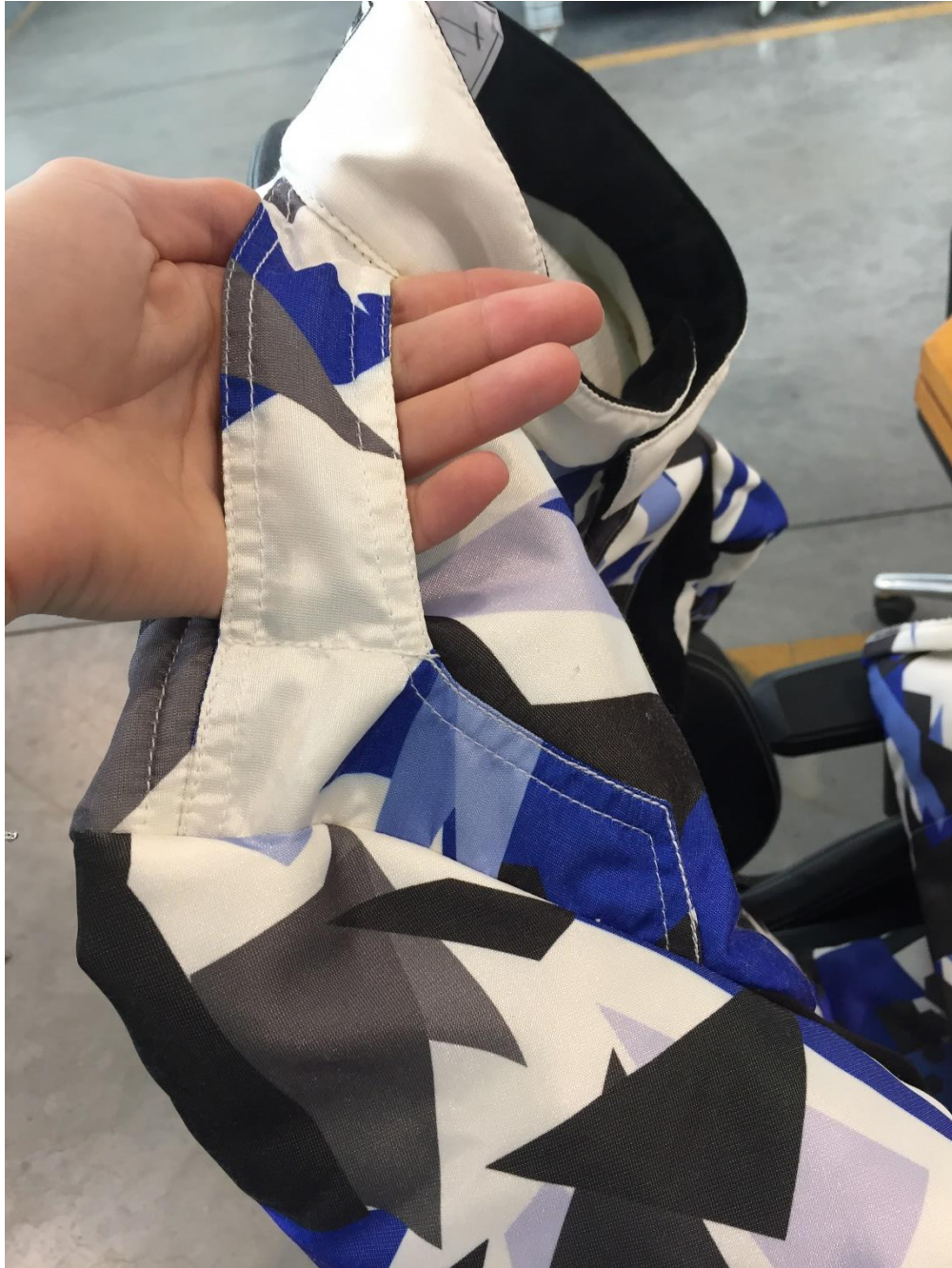
Les couleurs peuvent être modifiées. Colours may be changed.

B1) vue de \frac{3}{4} avec position de la main pour saisir la poignée \frac{3}{4} view with position of the hand for grabbing the handle