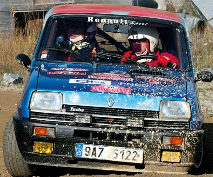
RENAULT R5 ALPINE TURBO - PETR MINÁŘÍK / PAVEL ŠUBRT